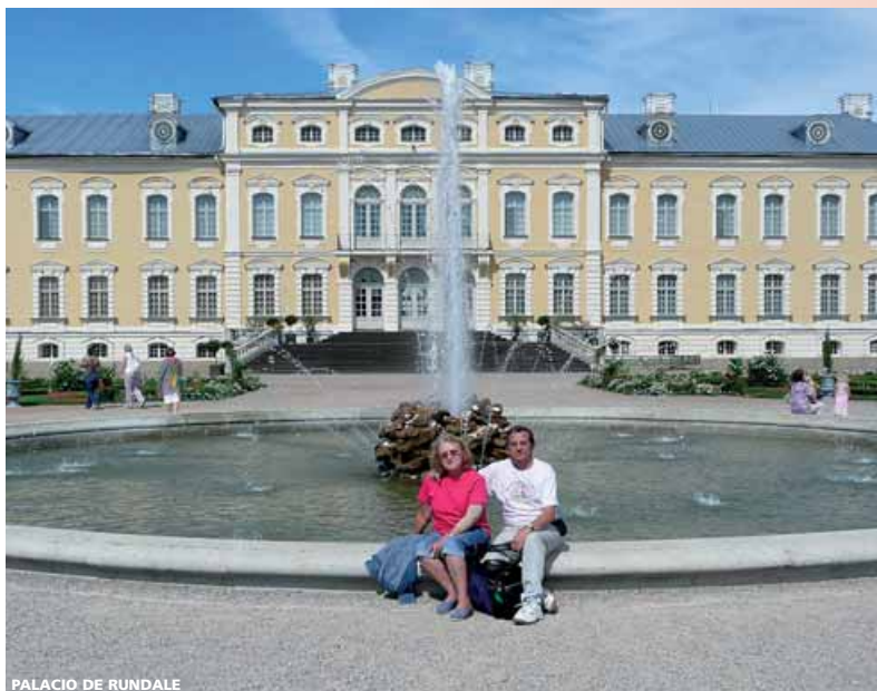
PALACIO DE RUNDALE

Nota: Consultar precios por salidas desde otras ciudades.