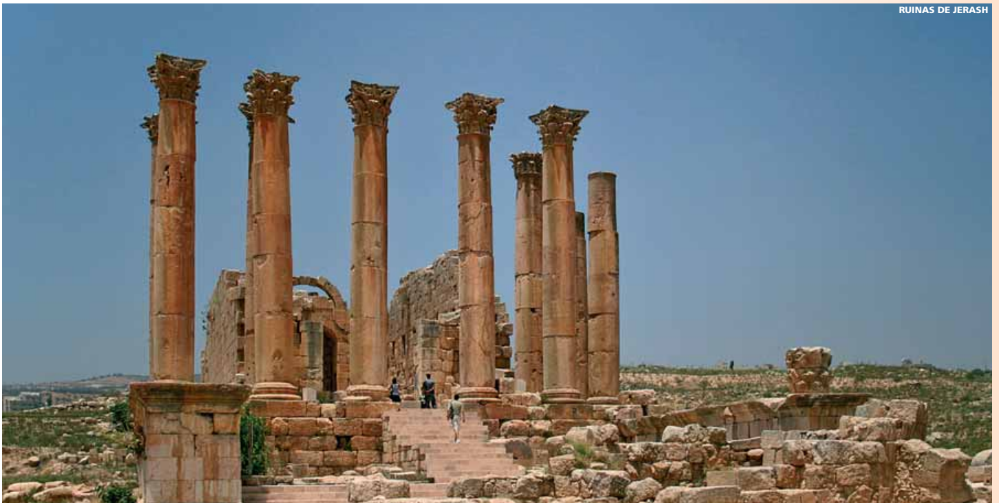
RUINAS DE JERASH

Magnífico, Santa Sofía, el gran Bazar, etc. Posibilidad de realizar excursiones opcionales como la visita histórica de la ciudad, Bósforo y Asia, etc. Alojamiento en el hotel.