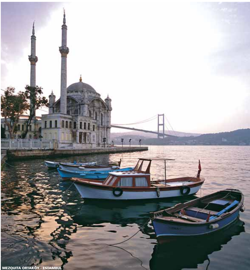
MEZQUITA ORTAKÖY - ESTAMBUL