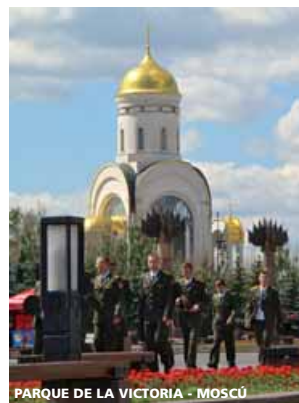
PARQUE DE LA VICTORIA - MOSCÚ

A la hora indicada, traslado al aeropuerto para salir en vuelo especial directo o regular vía punto europeo con destino a Madrid o Barcelona.