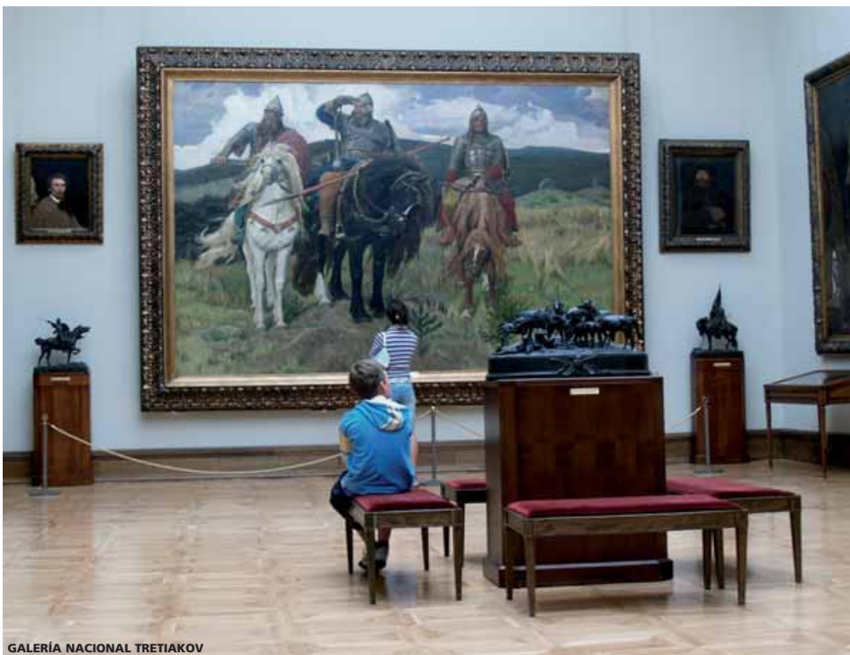
GALERÍA NACIONAL TRETYAKOV