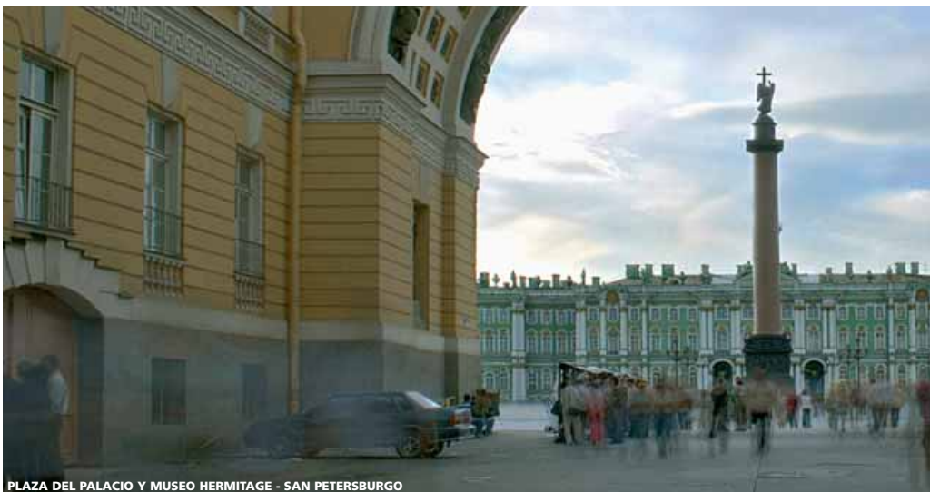
PLAZA DEL PALACIO Y MUSEO HERMITAGE - SAN PETERSBURGO