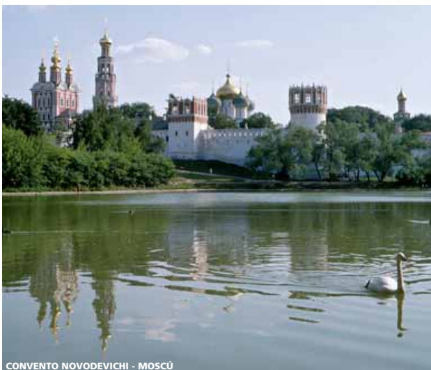
CONVENTO NOVODEVICHI - MOSCÚ

A la hora indicada, traslado al aeropuerto para salir en vuelo especial directo o regular vía punto europeo con destino a Madrid o Barcelona.