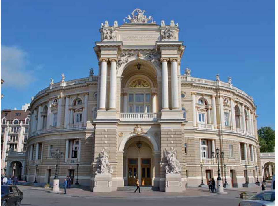
ÓPERA DE ODESA