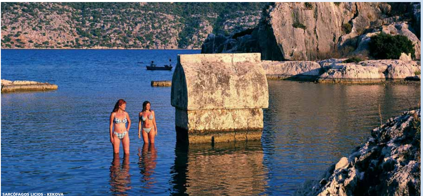
SARCÓFAGOS LICIOS - KEKOVA