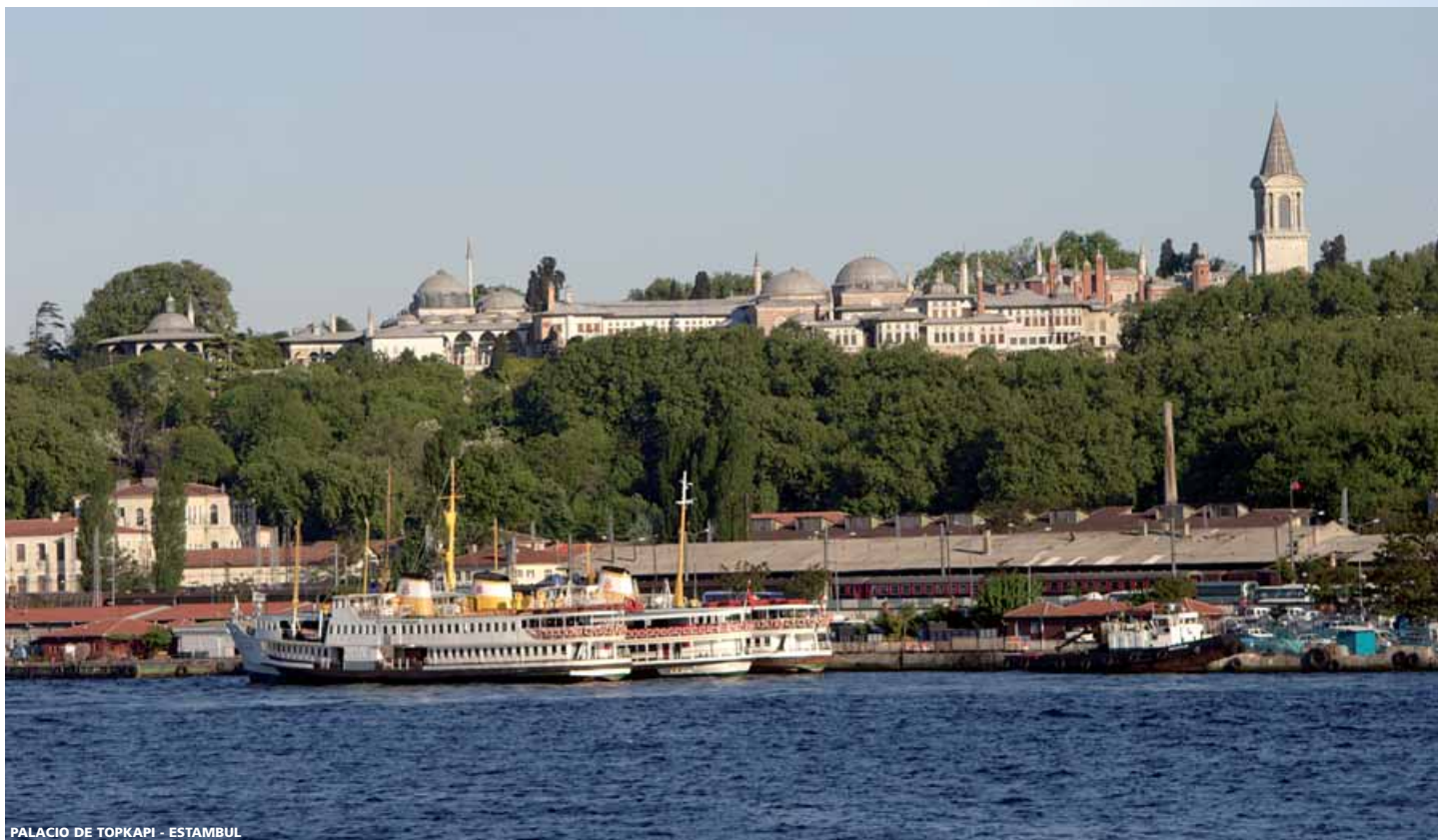
PALACIO DE TOPKAPI - ESTAMBUL